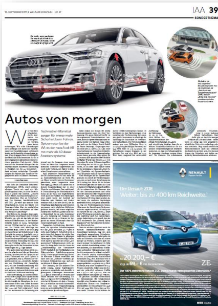
Beispielhafte Darstellung Sonderthemenseite IAA 2017

Quellen 1) DIE WELT inkl. Kompaktausgabe (außer Sa.), 2) IVW I/2018, 3) AWA 2017, 4) LAE 2017, 5) WELT AM SONNTAG inkl. Kompaktausgabe, 6) Verlagsangabe Q1 2018, 7) AGOF daily digital facts März 2018, Basis: 10+ Jahre; Einzelmonat März 2018