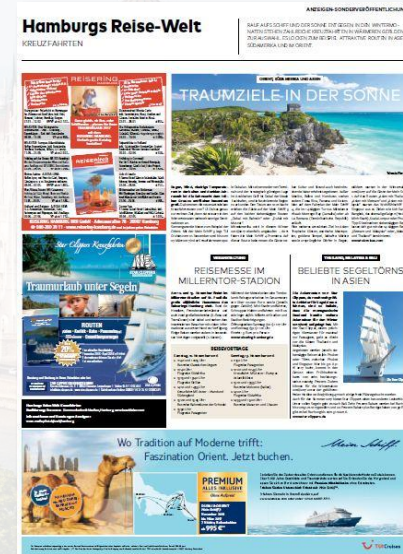
Musterseite Sonderveröffentlichung „Hamburgs Reise-Welt 2016

Zusätzlich zu Ihrer Anzeige haben Sie auf Wunsch die Möglichkeit, einen kleinen PR-Beitrag zu veröffentlichen.