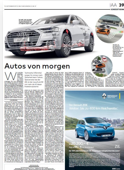
Beispielhafte Darstellung Sonderthemenseite IAA 2017

Quellen 1) DIE WELT inkl. Kompaktausgabe (außer Sa.), 2) IVW I/2018, 3) AWA 2017, 4) LAE 2017, 5) WELT AM SONNTAG inkl. Kompaktausgabe, 6) Verlagsangabe Q1 2018, 7) AGOF daily digital facts März 2018, Basis: 10+ Jahre; Einzelmonat März 2018