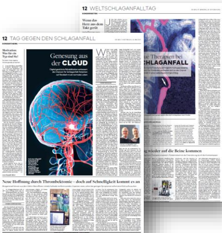
Beispiel-Sonderthema „Tag gegen den Schlaganfall“ 2016/2017