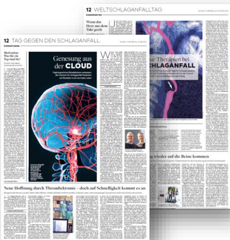
Beispiel-Sonderthema „Tag gegen den Schlaganfall“ 2016/2017