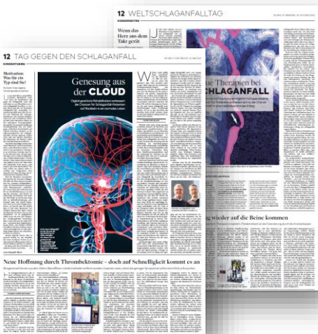
Beispiel-Sonderthema „Tag gegen den Schlaganfall“ 2016/2017