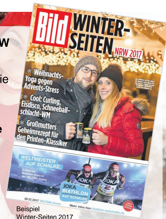
Beispiel Winter-Seiten 2017

Gerne beraten wir Sie zu besonderen Themen und Anzeigenformaten!