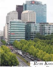
Rem Koolhaas über Schönheit am Bau und die Gesichter der Stadt

Denkmalraum geben diese an, wenn Unkonventionales einbezogen wird. In der Berliner Architekturgeschichte ist das ein Thema, das immer wieder aufkommt. In Berlin ist das Thema der Denkmalschutz ein zentraler Bestandteil der Stadtentwicklung. In Berlin ist das Thema der Denkmalschutz ein zentraler Bestandteil der Stadtentwicklung. In Berlin ist das Thema der Denkmalschutz ein zentraler Bestandteil der Stadtentwicklung.