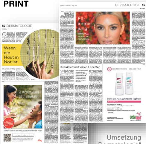
Umsetzung „Dermatologie“ März 2018