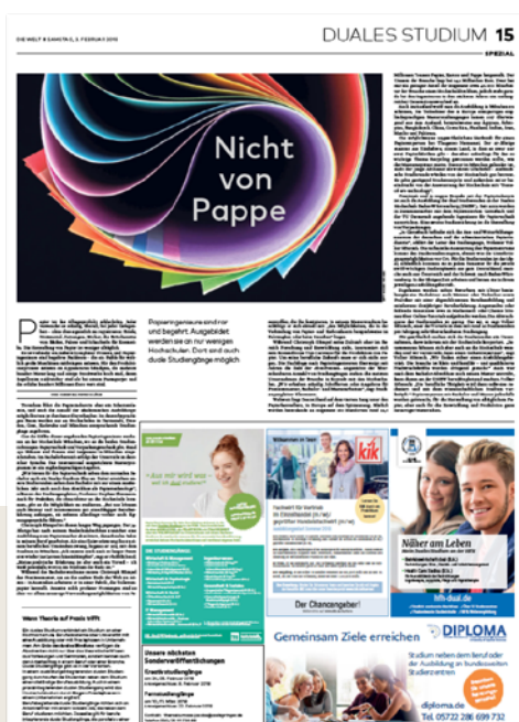
Abbildung DIE WELT 03.02.2018

Sie erhalten zwei Erscheinungstermine in der Kombination DIE WELT und WELT AM SONNTAG zu einem Preis, sowohl bei Buchung in den Sonderthemen als auch im wöchentlichen Bildungsmarkt.